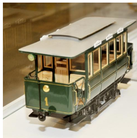
M=1:25 méretarányú modellek, köztük az első villamosé a kiállításban