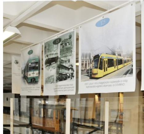
Az első villamostól a Combinóig, tablók a működő egysínű vasút felett

Vitrinben mutatjuk be azon villamosok M=1:25 méretarányú modelljeit, amelyek Budapesten közlekedtek és ma is lehet utazni rajtuk nosztalgia üzemben. Kiállítottuk Budapest első, alsóvezetékes villamosának modelljét (zöld színű!/, hiszen 1887-ben ezt szállította a próbavasút számára a Siemens & Halske cég), ami az időszak kiállítás után a Magyar Műszaki és Közlekedési Múzeum LGB terepasztalán fog üzemelni.