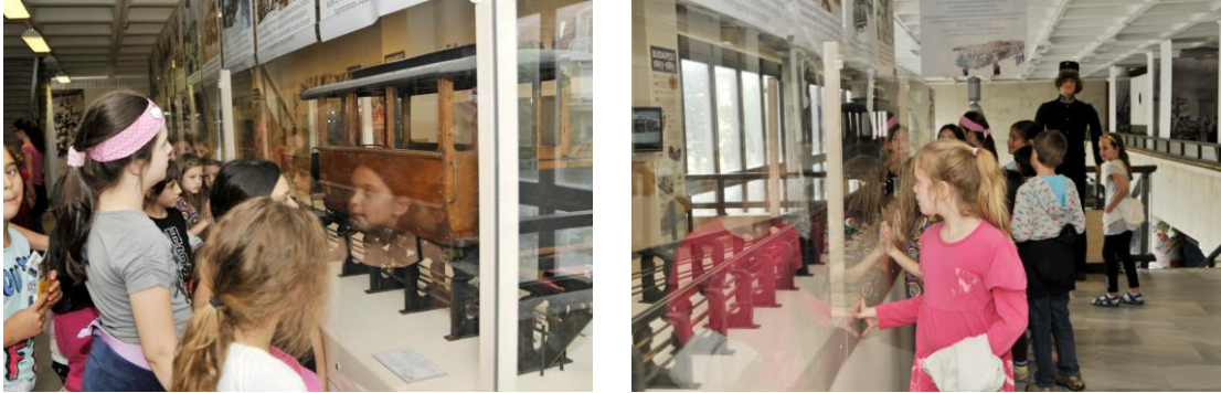
Érdeklődők – kicsik és nagyok – a Zipernowsky egysínű vasút előtt

A kiállítás alatt rendszeresen tartottunk múzeumpedagógiai foglalkozásokat, amelyek keretében a látogatók, első sorban a diákok megismerhették az alsóvezetékes rendszer lényegét működés közben.