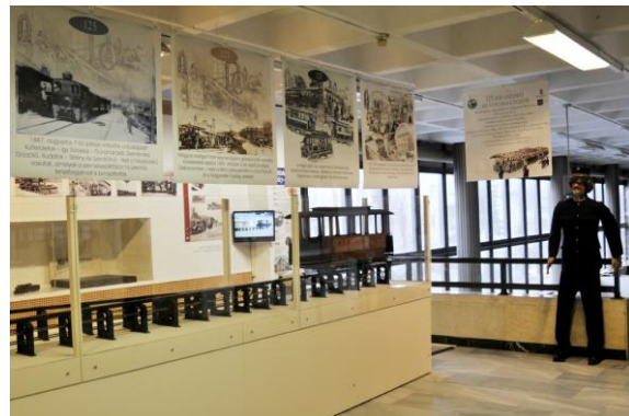
A „125 éves a budapesti hév és villamos” című kiállítás a működő Zipernowsky vasúttal

A 125 éves évfordulóra az egysínű vasutat a múzeum restaurátorai felújították és - méltóképpen installálva - az időszaki kiállítás fő attrakciójaként került bemutatásra.